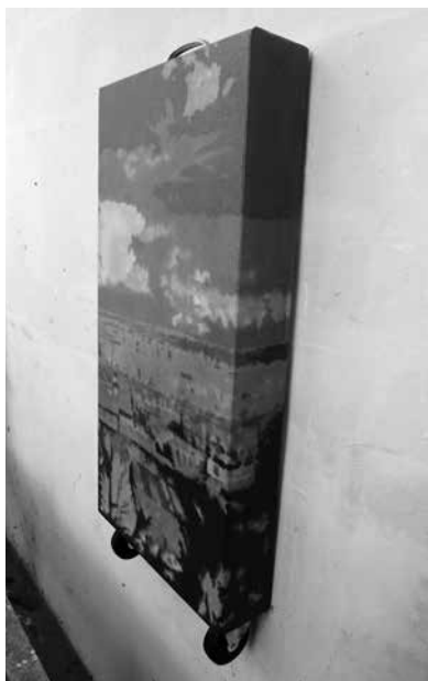
Acrílico y barniz sobre lienzo, 70X30X8cm, 2014