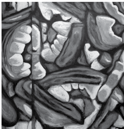
Candy Huaylas, Acrílico sobre tela, 161cm x 171cm, 2014