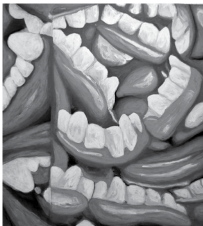
Acrílico sobre tela, 161 cm x 171 cm, 2014