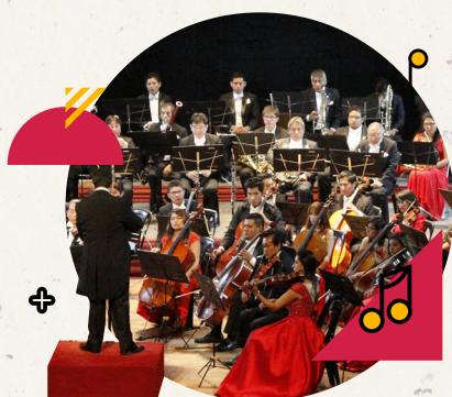
Orquesta Sinfónica de Arequipa